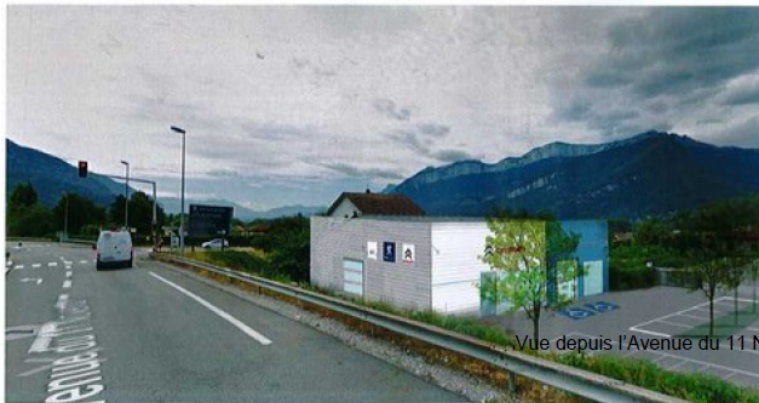
Vue depuis l'Avenue du 11 Novembre