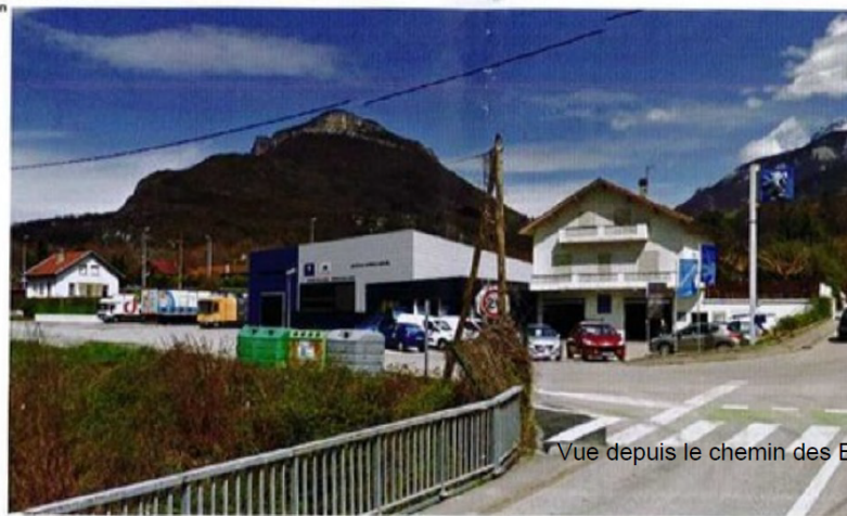
Vue depuis le chemin des Blockhaus