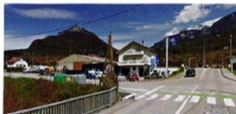
Vue avant insertion