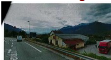
Vue avant insertion